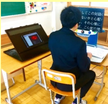
拡大読書器やiPadを使った学習の様子