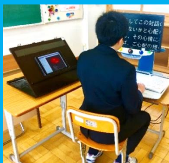
拡大読書機とiPadを組み合わせた学習の様子