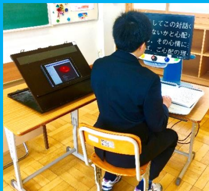
拡大読書機とiPadを組み合わせた学習の様子