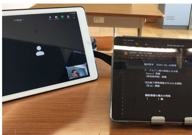
Zoomを使用した授業の様子

時期的に暑い日が続きそうです。原則はマスク着用ですが、周りに配慮しながらマスクを外す等の対応をしても結構です。