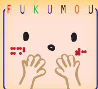
福井県立盲学校の ふくもうちゃん